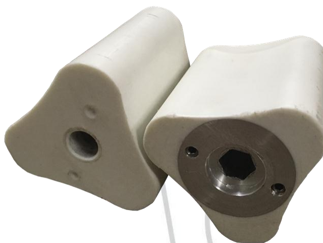
Комплект роторов (кулачков)