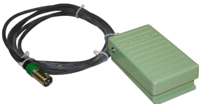
Педал управления для ДШ-37