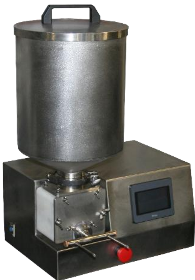
Шестеренчатый шприц-дозатор ДШ-37