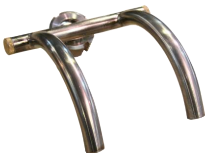
Насадка для орешков D15