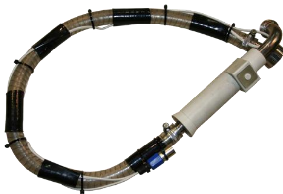
Дозирующий пистолет с армированным шлангом