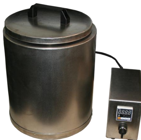
Бак с подогревом на 15 литров