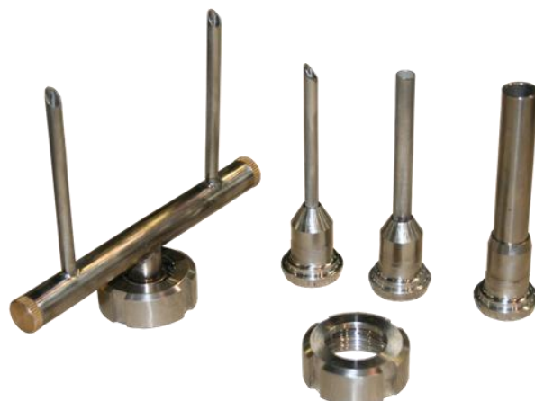
Комплект насадок базовой комплектации